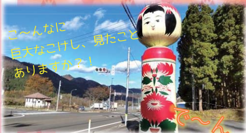
ごーんなに 巨大なごけし、見たこと ありますか？！