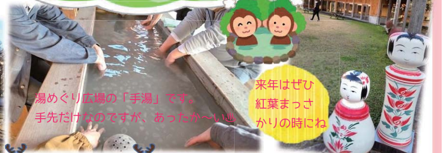
湯めぐり広場の「手湯」です。 手先だけなのですが、あったか〜い地