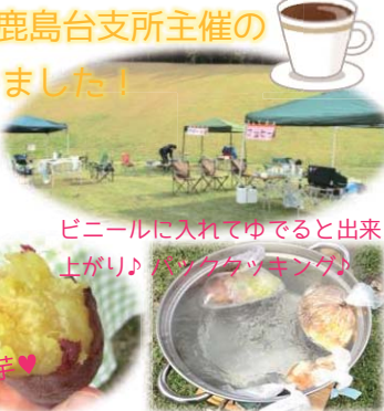
ビニールに入れてゆでると出来上がり♪（パッククッキング）

誰でもお悩み相談OK！焼き芋を食べながらお話をしたり、パッククッキングに挑戦したり…まさにほのぼのな会でした◎