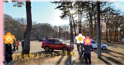
お天気がよかったです