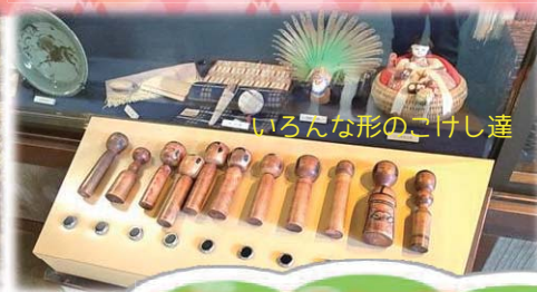
いろいろな形のごけし達