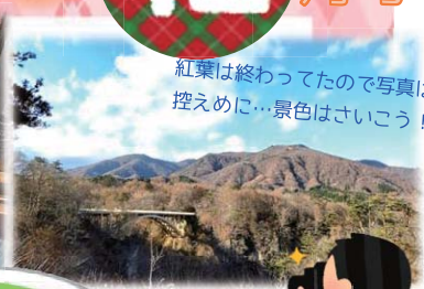
紅葉は終わってたので写真は 控えめに…景色はさいこう！

11月16日（火）、ちょっと紅葉は終わってしまいましたが（'-）鳴子峡へドライブに行ってきました♪普段ここてらす石巻の利用をされている方も参加し、賑やかなドライブとなりました☆