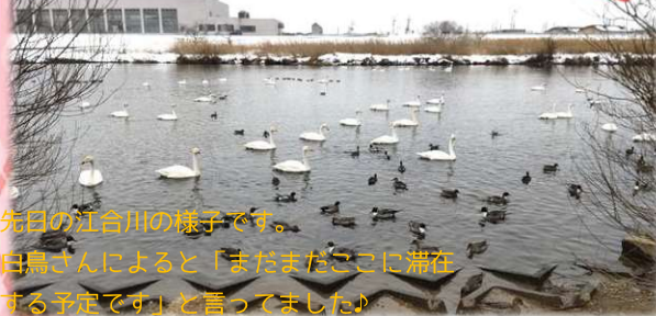
先日の江合川の様子です。白鳥さんによると「まだまだここに滞在する予定です」と言っていました♪