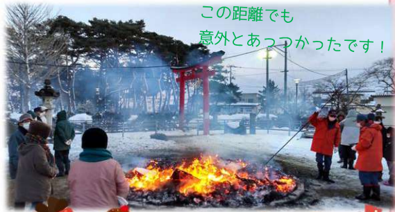
この距離でも意外とあつかったです!!