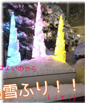
どこを歩けばよいのやら...