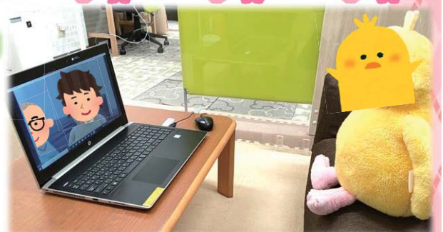
こんな感じでやってみました！※イメージ図です（^▽^）

そんな中でも、ここてらす古川・石巻とを、オンラ イン会議システム「Zoom」を使って交流してみよ う！とさっそくお試してみました！（^▽^）