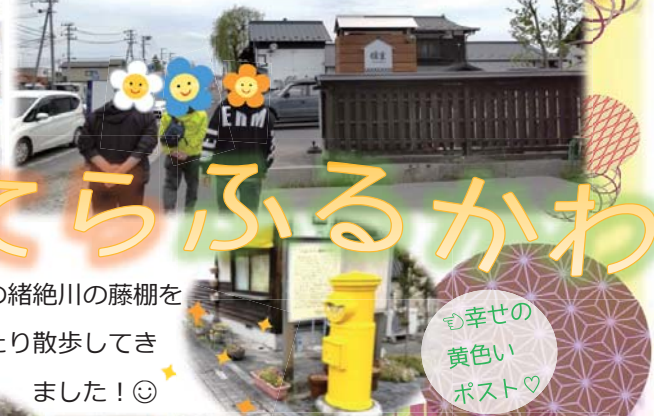
幸せの黄色いポスト♡

藤の「花→振袖に見える=女性」、 「幹→どっしり構える姿=男性」と例えられ、夫婦・男女の仲睦まじさを表されているんだとか ・・・(* ▽ *)