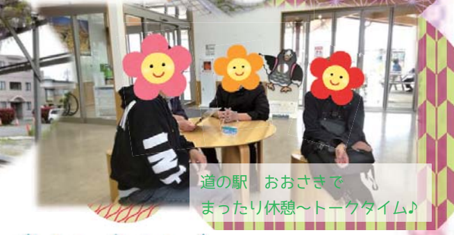
道の駅 おおさきでまったり休憩～トークタイム♪