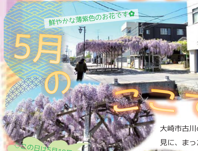
鮮やかな薄紫色のお花です🌸

緒絶川の近くには「食の蔵 醸室（かむろ）」があり、蔵の中で食事処があったり、特産品が販売されています