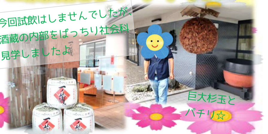
巨大杉玉とパチリ☆