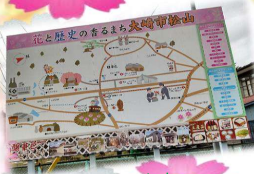
花と歴史の香るまち！大崎市松山へ

大崎市松山のコスモスと、宮城県では有名な酒蔵「一ノ蔵」の工場見学に行ってきました！！普段はなかなか見る事のない作業場に皆さん興味深々でした★