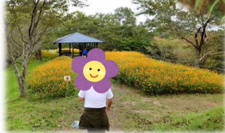
松山御本丸公園「コスモス園」へ

まずは古川のからあげ屋さんで腹ごしらえ！お弁当の蓋がしまらないくらいボリュームー