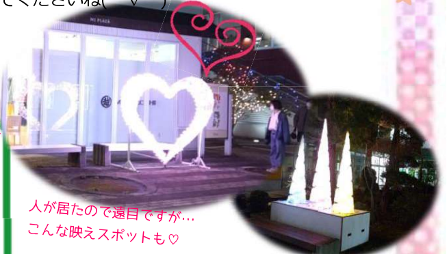
人が居たので遠目ですが... こんな映えスポットも♡

ここてらすが終わってからだとまだ早いのですが、夕方暗くなると古川もイルミネーションがきれいですよ。台町のリオーネの中にも、プチ映えスポットがあります！近くにはおしゃれなチョコレート屋さんや、フルーツサンド屋さんが出来たり、カフェやラーメン屋さんもあります。お買い物、映画鑑賞がてら、のぞいてみては？？ついでにここてらすにも遊びに来てくださいね(◡‿◡)