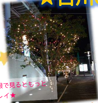
肉眼で見るともっと キレイ★

ここてらすが終わってからだとまだ早いのですが、夕方暗くなると古川もイルミネーションがきれいですよ。台町のリオーネの中にも、プチ映えスポットがあります！近くにはおしゃれなチョコレート屋さんや、フルーツサンド屋さんが出来たり、カフェやラーメン屋さんもあります。お買い物、映画鑑賞がてら、のぞいてみては？？ついでにここてらすにも遊びに来てくださいね(◡‿◡)