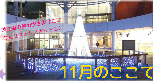
映画館の前の吹き抜けには こんなフオトスポットも♪