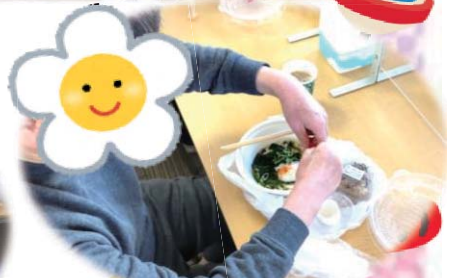
念願のわかめうどん♡