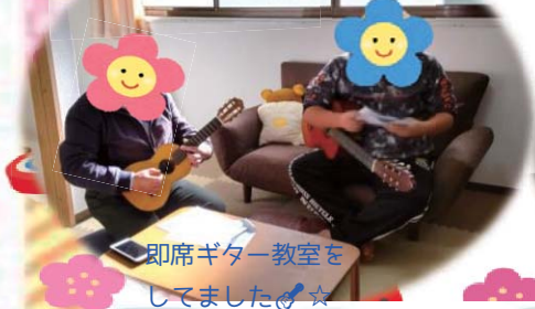
即席ギター教室を してました☆

フリースペースなどりとのZoom交流会★なとり女子のパワーに押されて、 固まっています。笑