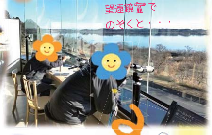
望遠鏡でのぞくと・・・