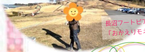
長沼フートピア公園をのんびり散策♪ 「おかえりモネ展」見学しました！