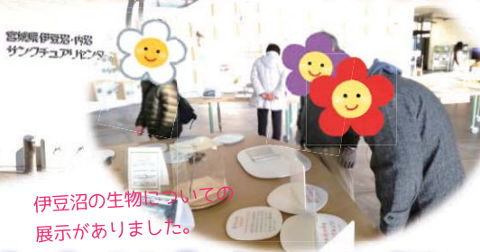
伊豆沼の生物についての展示がありました。

去年はコロナ禍もあり中止になった、わたり鳥観察へ！ 登米市の伊豆沼・内沼サンクチュアリーセンターまでドライブに行ってきました☆