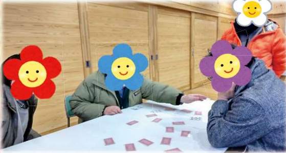
またトランプブームが来ています♠