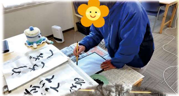
書初め第二弾・・・達筆♠