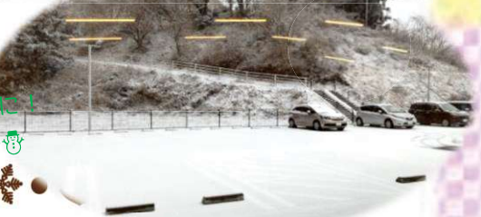
南三陸町の 出張居場所 の日に大雪に！ まっしろ～♠