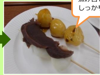
■大きな団子や小さな団子。団子にも作った人の個性が出ました！