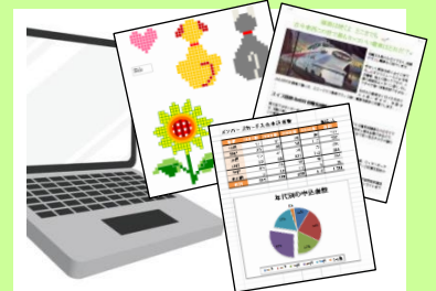
■PC 講座で、Excel でドット絵に挑戦！