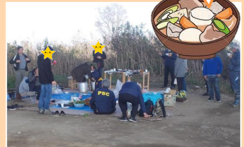
■自然の中で、食べる芋煮は格別の美味しさ！