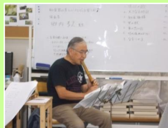
■尺八で奏でる曲は懐かしい曲満載！