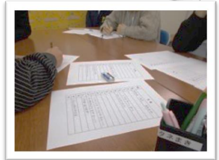
■内容も色んな側面から考えました