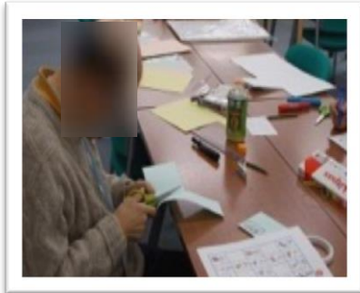
■紙はどんな材質が良いか検討中