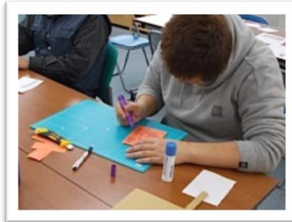
■数点のサンプルづくり