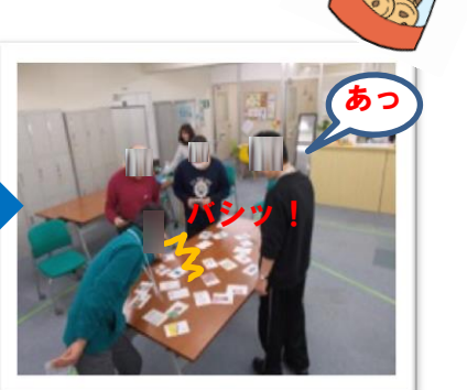
■「はい！！」とSさん。さすが早い！