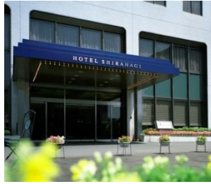
■「ホテル白萩」正面入り口