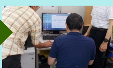
■インターネットで調べ中