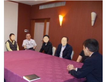
■見学を終えてのふりかえり