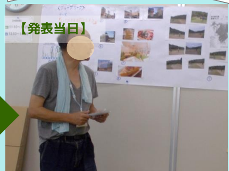
■各場所の発表担当を決め、順番で発表していきました