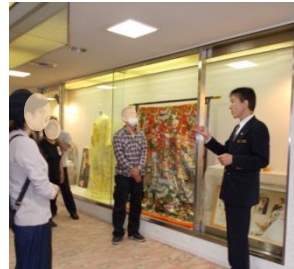
■最初にホテルの概要を説明をしていただきました