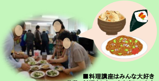
■料理講座はみんな大好き 普段、料理をしない方も楽しめます