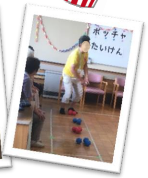
■ポッチャ体験コーナー