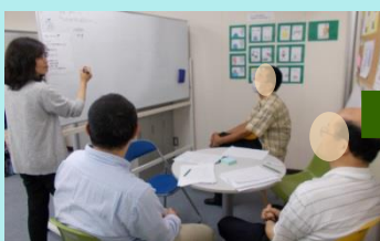
■アイデア出し：思いつく「とっておき」をどんどん出していきました