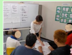
■SST(ソーシャルスキル レーニング)