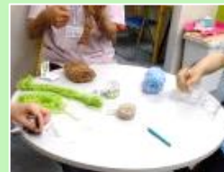
■アクリルたわし作り