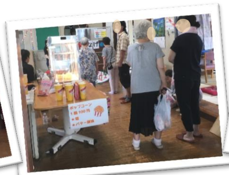
■ポップコーン売り場