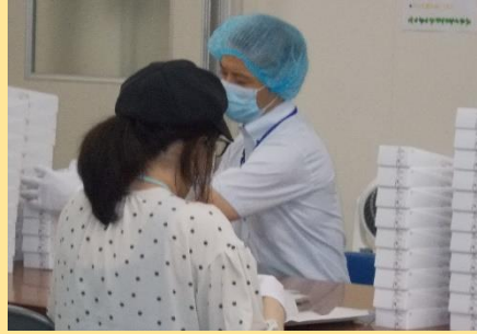
■箱おり（食品、お菓子、など） お盆前に一気に作業が増えました。