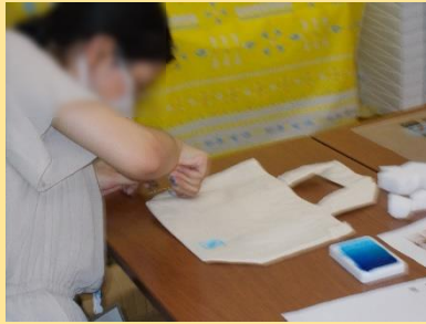
■生活講座（エコバッグづくり） 今やエコバッグは必需品 既成のバッグに自由にペイントをして オリジナルバッグづくりをしました。