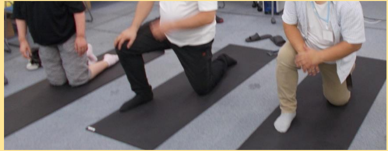
■スポーツ（ストレッチ、座位トレーニング） 運動不足を解消するために無理なく体を伸ばして健康的な時間をすごしました。また、ストレッチはリラックス効果もあり、終わった後の皆さんの表情はとてもおだやかでした。