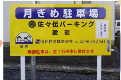
③黄色い看板が目印です！ 「17番」に停めてください。