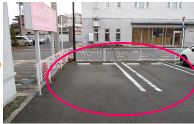
一番奥、その隣の2台分使用可能です