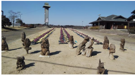
古代の里には、 謎の木の動物がたくさん(°°)