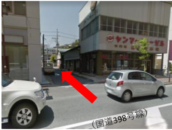
①市役所側から見たところです。ヤンマーさんから入り、止まっても真っすぐ進みます。