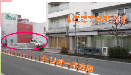
リオーネさん隣、ピンクの美容室の看板がある駐車場です！