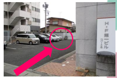
ビル裏にも1台駐車可能です！