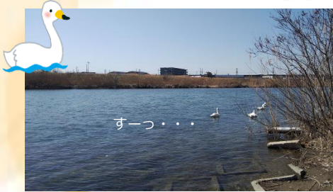
えさやりおじさんが居なくなると、 姿を消す白鳥たち…

天気の良い日に古川周辺（江合川、古代の里） へドライブに行きました🚗 桜が咲いたら、お花見ドライブもいいですね♪