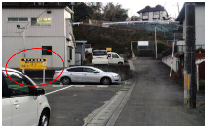
②グーグルマップだと写真が古いですが、駐車場が見えてきます。