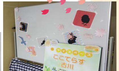
ここてらすの中にも 桜を咲かせてお待ちしております☺

出かけることに不安がある時期ですね。お電話でも、 ここてらすのご紹介をしています。少しでも気にな ったら、お電話ください。お待ちしております。