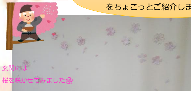
玄関には 桜を咲かせてみました🍵